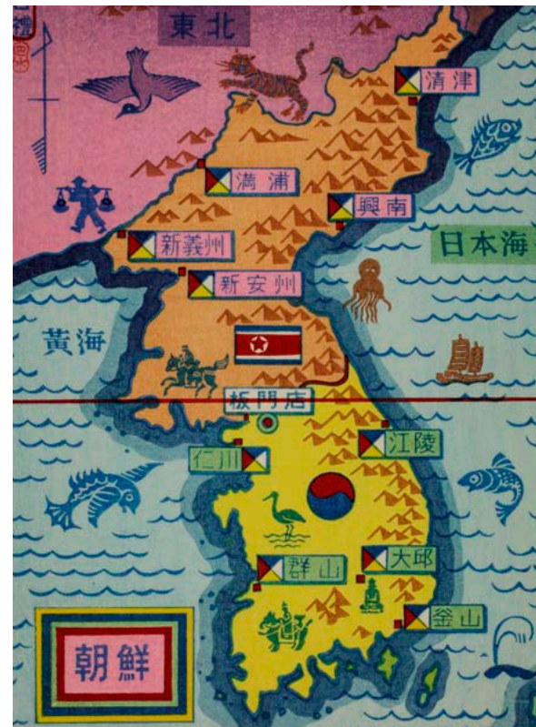
4) Karte von Korea, Holzschnitt im Buch «Korea» von Paul Eynard, 1955

L'armistice de la guerre de Corée (1950–53) a divisé la péninsule en deux États par une ligne de démarcation le long du 38e parallèle. Deux commissions ont vu le jour: la CSNN et la Commission de rapatriement des nations neutres (CRNN). Quatre pays neutres, la Pologne, la Tchécoslovaquie, la Suède et la Suisse, sont désignés pour surveiller l'accord. Au «camp suisse» de Panmunjeom, les Suisses vivent d'abord dans des tentes.