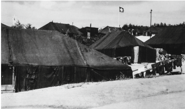
2) Swiss Camp, Panmunjom 1953/54

L'armistice de la guerre de Corée (1950–53) a divisé la péninsule en deux États par une ligne de démarcation le long du 38e parallèle. Deux commissions ont vu le jour: la CSNN et la Commission de rapatriement des nations neutres (CRNN). Quatre pays neutres, la Pologne, la Tchécoslovaquie, la Suède et la Suisse, sont désignés pour surveiller l'accord. Au «camp suisse» de Panmunjeom, les Suisses vivent d'abord dans des tentes.