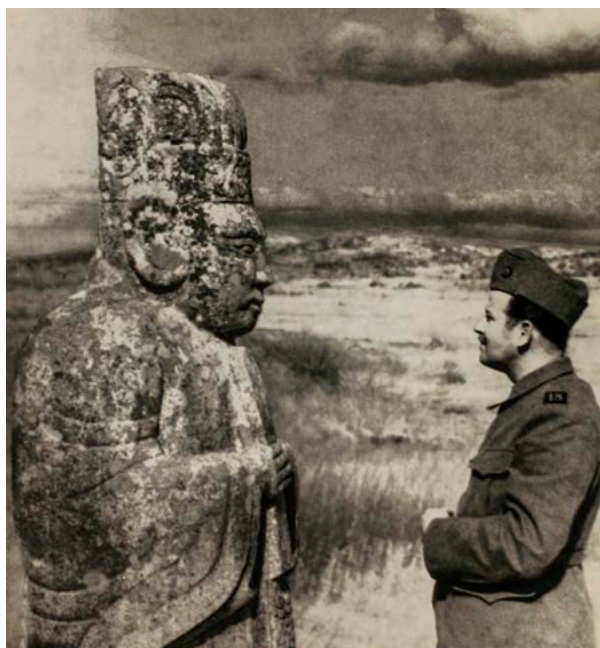
1) Fotografie aus dem Freundschaftsbuch «Korea» von Paul Eynard, 1955

Photographie tirée du livre de l'amitié «Korea» de Paul Eynard, 1955